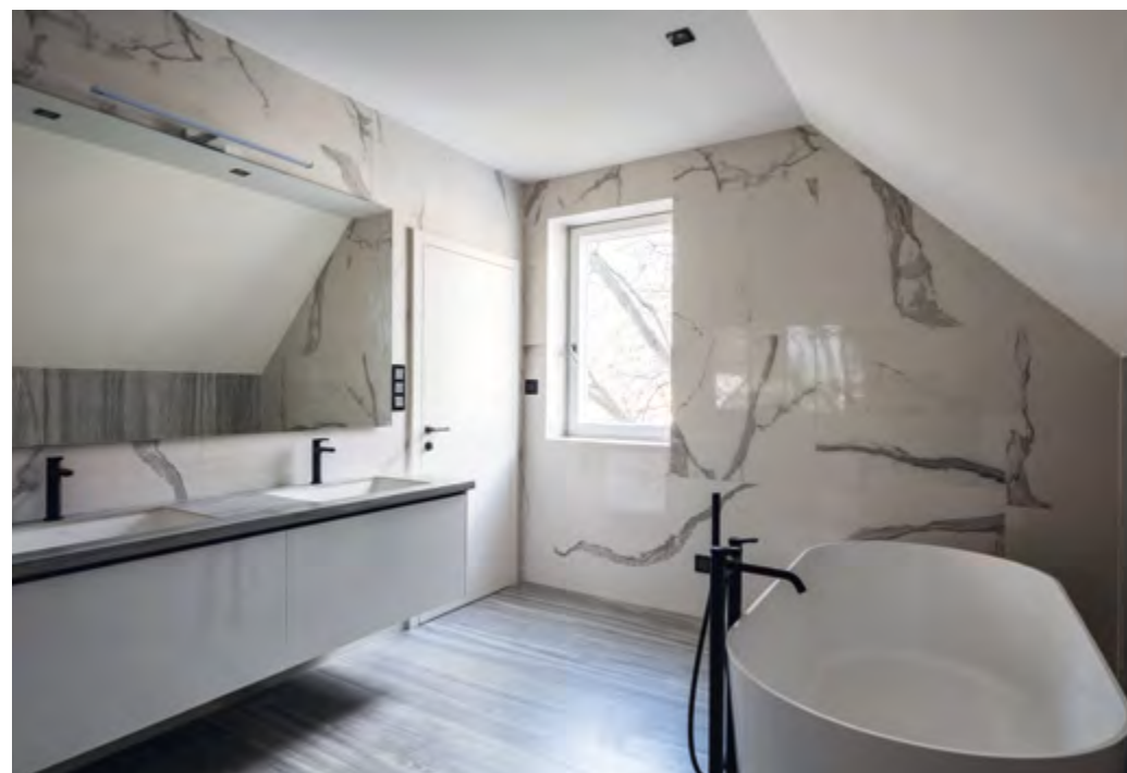
> A galéria alatti hálószobához tartozó fürdő részlete

Tervező: KARDOS JUDIT (ISCA DESIGN) Tervezés éve: 2019 Megvalósítás éve: 2020 Alapterület (nettó): 227