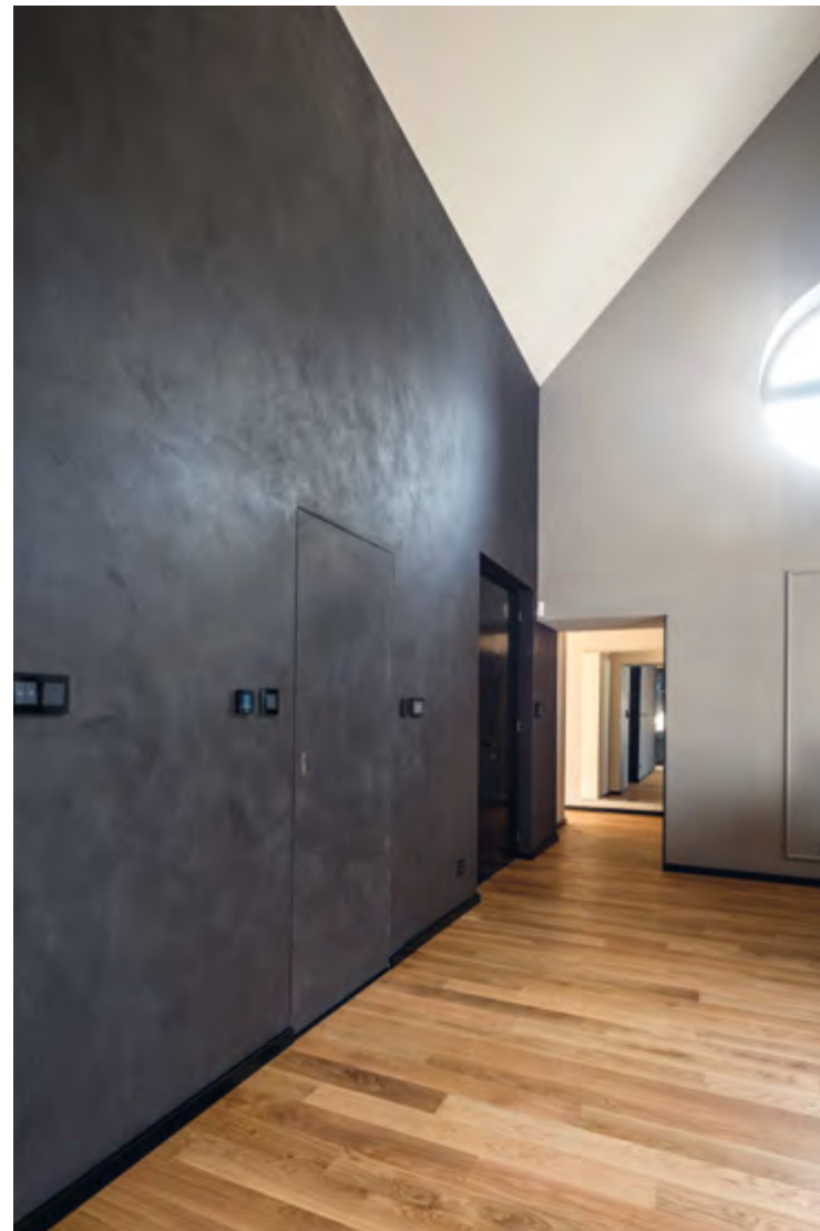
^ Itt látható a bejárati oldal az érzéki felületű, egységes szürkében tartott, impastós felületű fallal és a tok nélküli bejárati ajtóval

Tervező: KARDOS JUDIT (ISCA DESIGN) Tervezés éve: 2019 Megvalósítás éve: 2020 Alapterület (nettó): 227