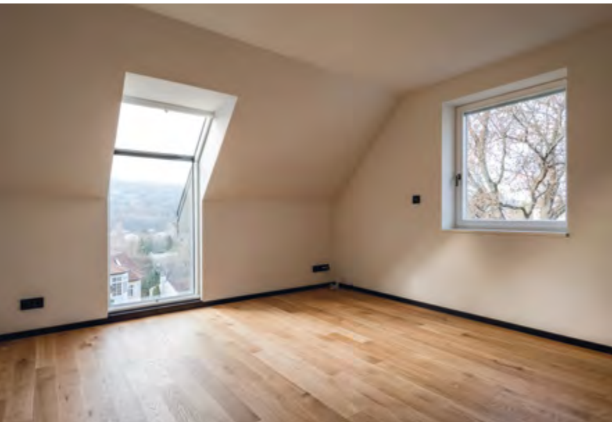
^ A nappali felől megközelíthető privát lakrészek egyik, berendezés előtti hálójának részlete